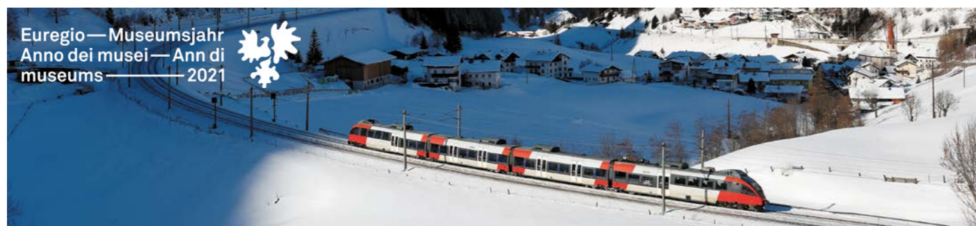
Entdecke die Museen bequem mit dem Zug und nutze dabei weitere Angebote wie das Euregio2Plus Ticket. Scopri i musei comodamente con il treno e approfitta di altre offerte come il biglietto Euregio2Plus.

Seit letztem Jahr gibt es das Euregio-FamilyPass Malbuch, das dich auf eine malerische Entdeckungsreise durch Tirol, Südtirol und das Trentino mitnimmt. Hier erfährst du vieles über Geografie, Kultur und Geschichte der drei Länder und kannst richtig kreativ sein. Damit wirst du selbst zur Künstlerin und zum Künstler. Eine Vorlage zum Ausmalen findest du auf der rechten Seite. Das Malbuch zum Herunterladen und weitere Informationen gibt es unter www.familypass.eu